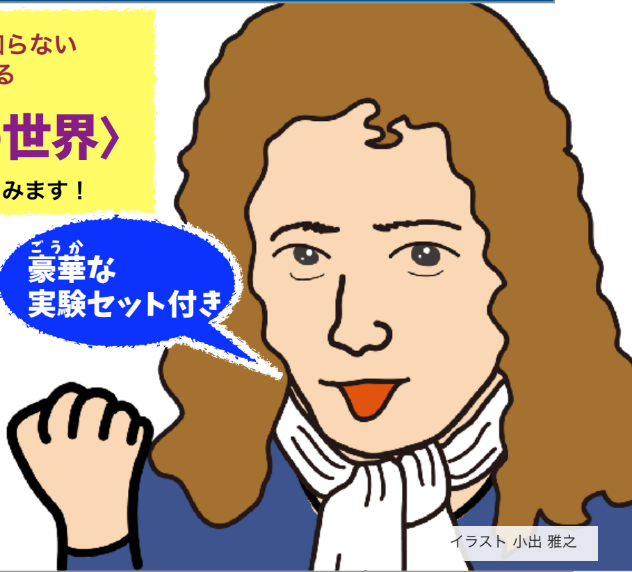
イラスト 小出 雅之

好奇心いっぱいの 親子孫・大人のみなさんへ お知らせです！ 2日間まるごとの〈本格的な科学入門教育〉の講座です！ 小学校高学年，中学生，高校生，大学生の参加也大歓迎！